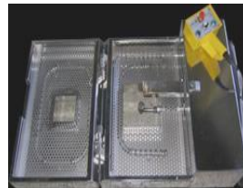
Brandwanne für Brandklasse C